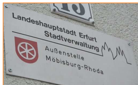
Außenstellen in den Ortschaften - Entscheidungen mittragen?

Da der inhaltlich damit verbundene Antrag, Informationen über die Selbstverwaltungsmittel für die Ortsteile